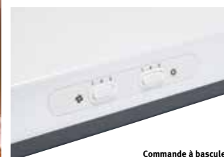
Commande à bascule Modèle C180